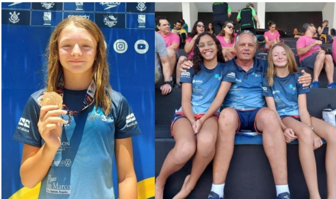
Fotos com patrocinadores

09 a 11/12 – Campeonato Paulista Petiz de Verão